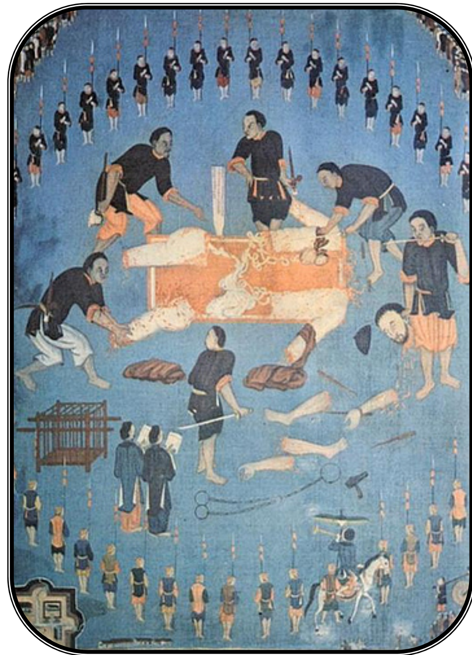
Martirio del Beato Juan Carlos Cornay

Vedme aquí, pues, encerrado cual si fuera un lobo — refiere festivamente el misionero —. En esta jaula, estuve al menos al abrigo de los golpes que repartían a troche y moche. Además, una