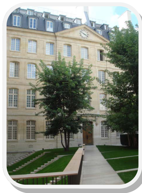
El Seminario de las Misiones Extranjeras de París, hoy en día

Trescientos soldados forman el cortejo y alrededor de la jaula del mártir se ordenan los verdugos, sa- bles y hacha en mano. Ante la jaula,