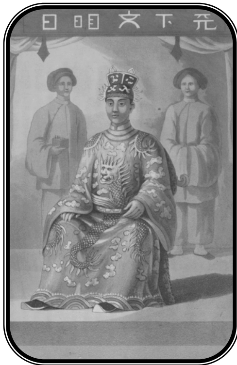
Minh Mang (1791—1841), Emperador del Tonkin, Llamado el “ Nerón anamita ”.

Consolaos, pues; en breve todo habrá terminado y yo estaré esperando en el cielo.