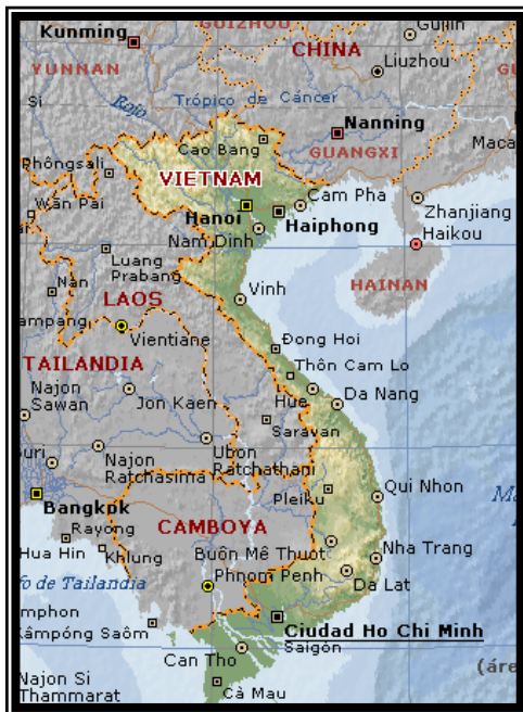
El actual Vietnam, antiguamente llamado Tonkin

Hacia las cinco, viendo que mi ayuno se prolongaba, pedí al mandarín un poco de arroz. Me dieron tres cucharadas, que fueron toda mi refeción. Así se terminó el primer día. Me