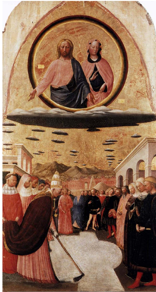
La nieve milagrosa indica el lugar de la futura basílica

No tenía hijos, y de acuerdo con su mujer, no menos noble ni menos virtuosa que Juan , resolvió dejar por heredera a la Santísima Virgen , que después de Dios era el todo para el virtuoso caballero. Comunicado el intento con su esposa, que animada de la misma piedad lo estaba también de los mismos devotos pensamientos, determinaron hacer muchas oraciones y limosnas para que la Virgen se dignase manifestarlos en que cosa más de su agrado emplearían los bienes que ya tenían dedicados a su servicio.