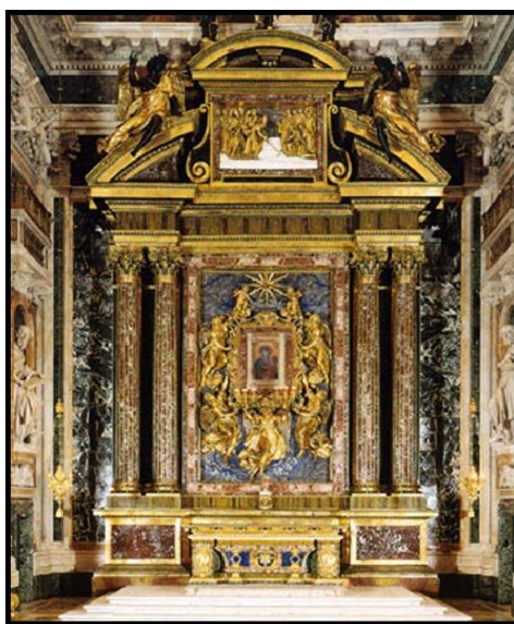
Imagen pintada por el mismo S.Lucas, y el altar actual donde se conserva en la basílica

todoxos, no sólo en orden a defender el dogma particular de que trataba, sino en exaltar más y más las grandezas y excelencias de la Virgen, cuanto el error y la malignidad más se empeñaban en abatirlas; en pronunciar cada día más frecuentes panegíricos, y en edificarle nuevos templos hasta en la misma capital del Imperio; todo ese vivo, eficaz, ardiente y universalísimo celo, ¿qué otro fundamento podía tener sino el de la establecida y permanente tradición? ¿Ni cómo la pudiéramos ya poner en duda, aunque ignoráramos los canales por donde se derivó hasta nosotros?