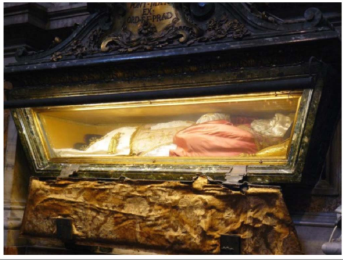
Cuerpo incorrupto de San Pío V conservado en la basílica

En sola Roma se cuentan más de sesenta iglesias dedicadas a su nombre. No se mostró menos devota ni menos magnífica Constantinopla, tanto en la suntuosidad como en la multitud de templos que la consagró, pues por su grande número se llamó en algún tiempo la ciudad de la Madre de Dios . No había calle donde no se venerase alguno; no había palacio ni casa de alguna consideración sin alguna capilla u oratorio dedicado a la Virgen . El templo más célebre de todos era el que se edificó extramuros de la ciudad, en el sitio que se llamaba Balquerna, de orden y a costa de la Emperatriz Pulqueria .