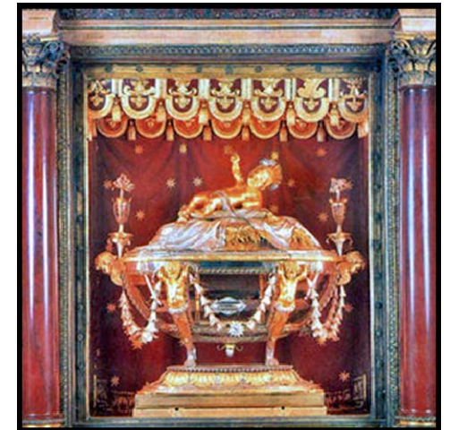
Urna con las reliquias del pesebre

tros tiempos siguen las mismas opiniones que siguieron San Atanasio , San Crisóstomo y San Cirilo . De la misma manera nos la comunicó San Bernardo , habiéndola recibido de San Ambrosio , San Jerónimo , San Agustín , y de los primeros Padres de la Iglesia latina. Aunque no tuviéramos otra prueba, dice este siervo de María , de que esta tradición viene derivada de los Apóstoles, que la mucha fuerza que ya tenía cuando se celebró este concilio Efesino, ¿quién podría racionalmente dudar de ella? Aquel unánime pensamiento de los sabios, del pueblo, de los santos, de la cabeza visible de la Iglesia, de todos los obispos católicos, que no pudieron desvanecer todos los artificios ni toda la conjuración del partido nestoriano; aquel ardor de todos los or-