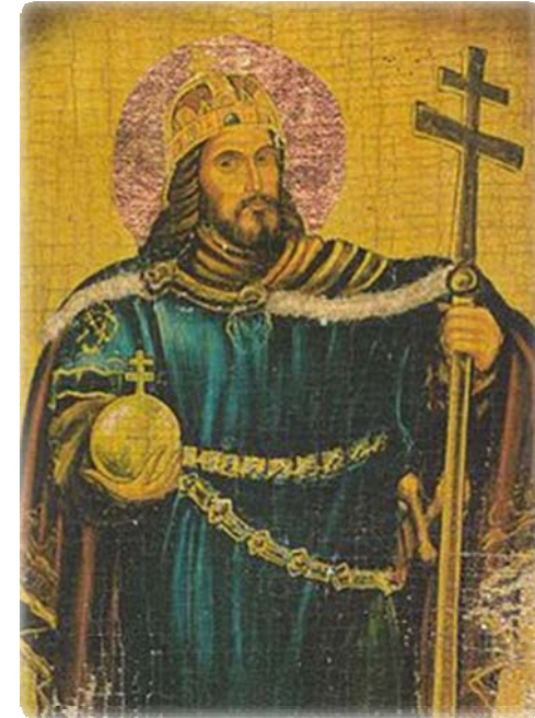
San Esteban, Rey y apóstol de Hungría, Tío de San Ladislao (969 - 1038)

Le hizo entender Ladislao el poco apego que le merecía la coro-