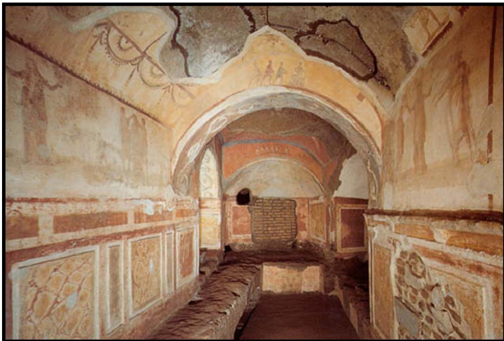
CATACUMBAS DE PRISCILA (Vía Salaria, Roma) Donde fueron sepultados San Félix y San Felipe

dres carnales temen sobrevivir a los suyos. A la gloria de su martirio particular, dice el mismo santo Padre en la homilía que predicó sobre Santa Felicitas , se puede decir que añadió la del martirio de sus hijos, y que fue ocho veces mártir.